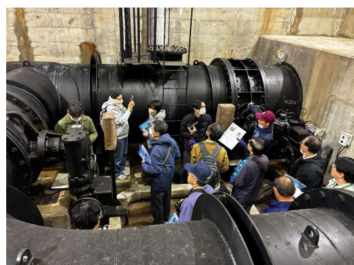
バルブ室見学の様子