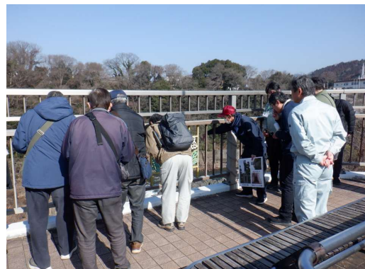
はねたき橋からの見学の様子