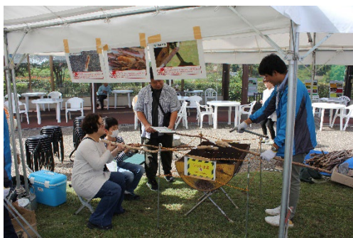
どんぐりの棒パン焼き