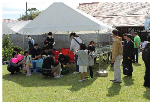
生き物観察・スーパーボールすくい