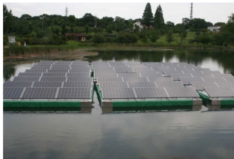
農業用ため池を活用した太陽光発電