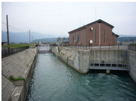
用水路の落差工を活用した小水力発電

農業水利施設を活用した小水力発電の適地としては、落差や流速のエネルギーを活用できるダム、頭首工、落差工、急流工、開水路、パイプラインなどが挙げられます。