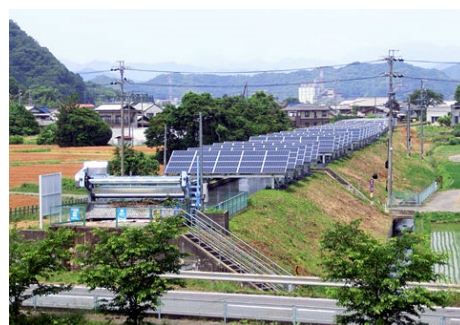
農業用水路を活用した太陽光発電