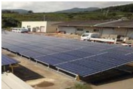
ファームポイントの空閑地を活用した太陽光発電