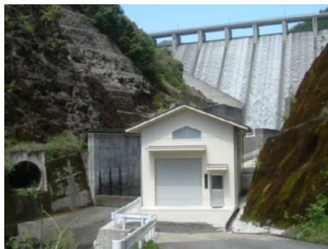
農業用ダムの落差を活用した小水力発電