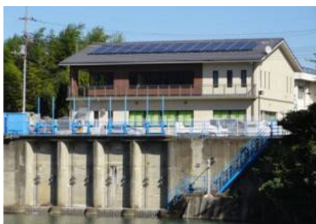
管理所の屋根を活用した太陽光発電

農業水利施設を活用した太陽光発電の適地としては、日当たりの良い機場建屋等の屋根、水路の上部、貯水池等の空閑地、ため池の法面や湖面などが挙げられます。