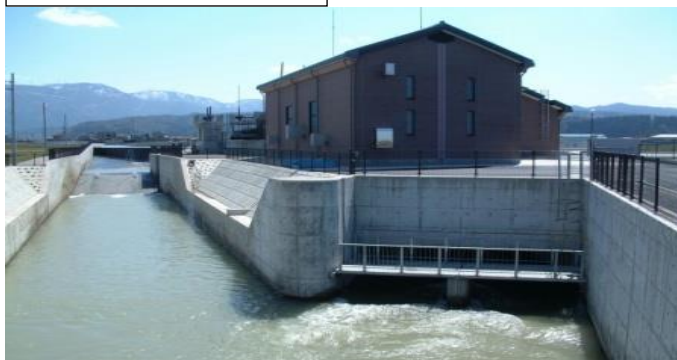
発電所の全景(下流より)