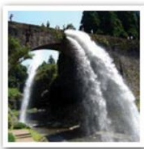
6. 歴史的な資産を今に伝える。