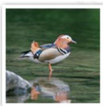
2. 生き物のつながりを守る。