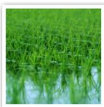
3. 水や空気をきれいにする。