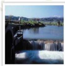
1. 田や畑に水を送り食物をつくる。