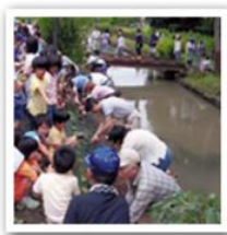
8. 人と人とのつながりをつくる。