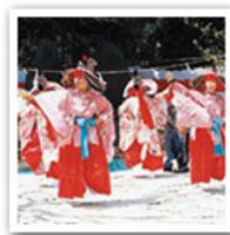
5. 地域の伝統や文化を生み出す。