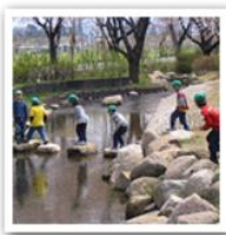
7. 人のこころをはぐむ。