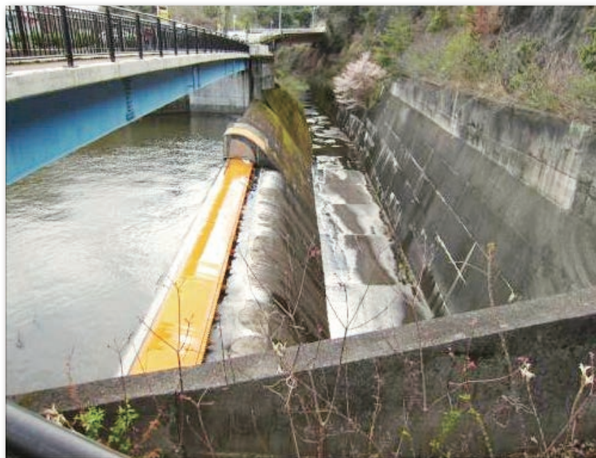
現在の入鹿池（余水吐と放水を上流から望む）