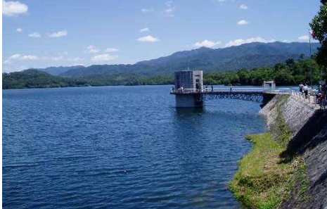
上：1914年の取水塔工事の様子 下：現在の満濃池（正面・取水塔）