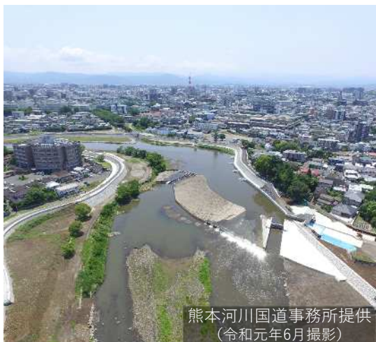
熊本河川国道事務所提供 (令和元年6月撮影)

■ 当時の最先端技術によるこれら施設は、地域の自主的な維持管理もあって、度重なる災害にもかかわらず、機能を失うことなく現在も利用されている。