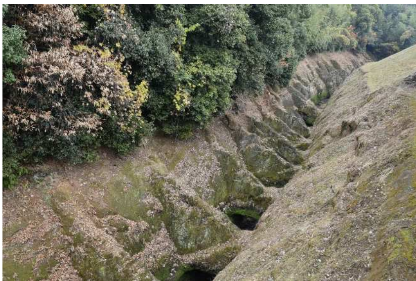
土砂堆積抑制の機能を持つ「鼻ぐり井手」（馬場楠井手用水）