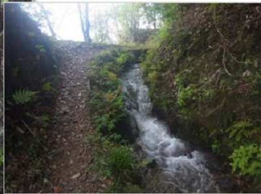
自然の地形（花崗岩） を活かした減勢工