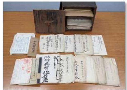
地域住民による維持管理の記録