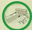
今も残るレンガ 組みの疎水路