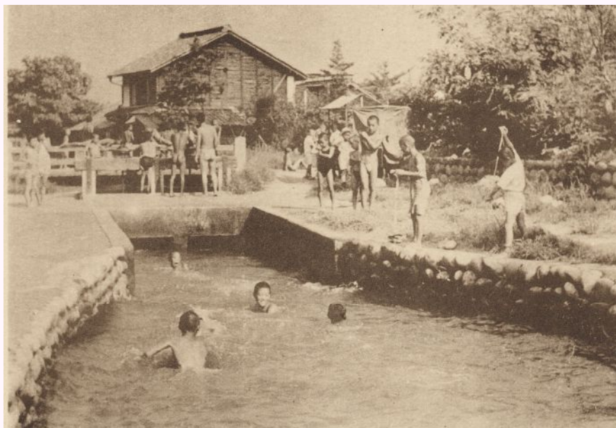
宮田用水土地改良区より