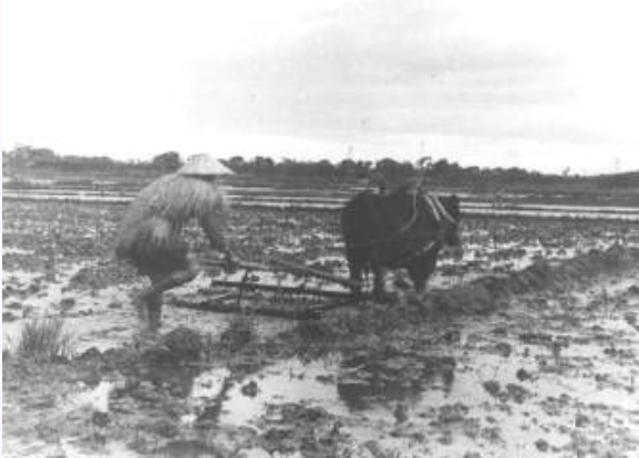
牛つかいのようす (亀田郷土地改良区HPより)