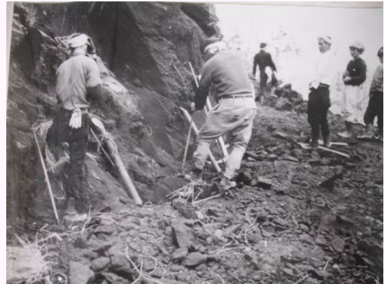
水路掘削床堀 (高千穂土地改良区より)