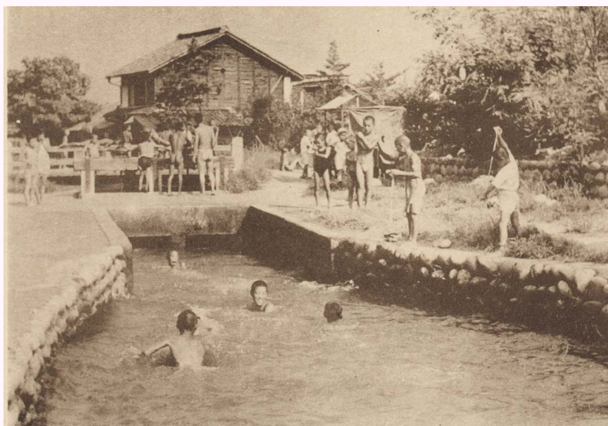
宮田用水土地改良区より