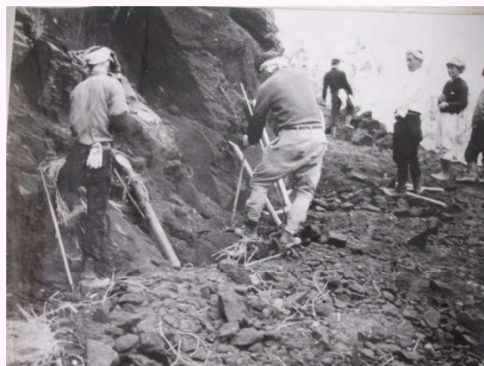
水路掘削床堀 (高千穂土地改良区より)