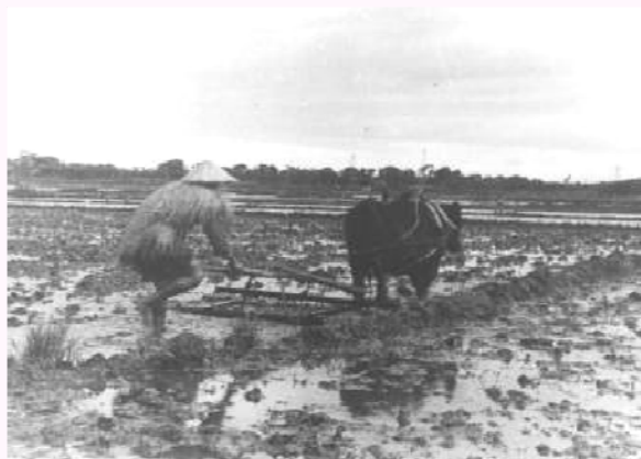
牛つかいのようす