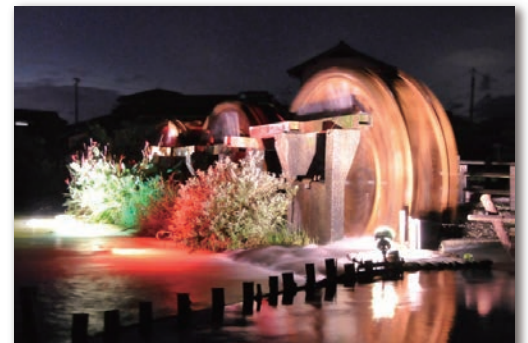
あさくら三連水車 (ライトアップ時)