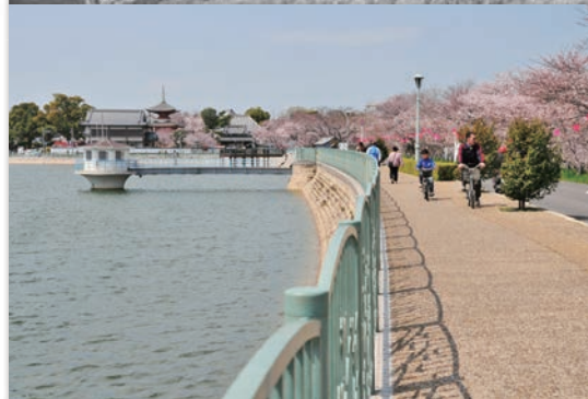
上：1965年ごろの久米田池の様子 下：現在の久米田池と久米田寺