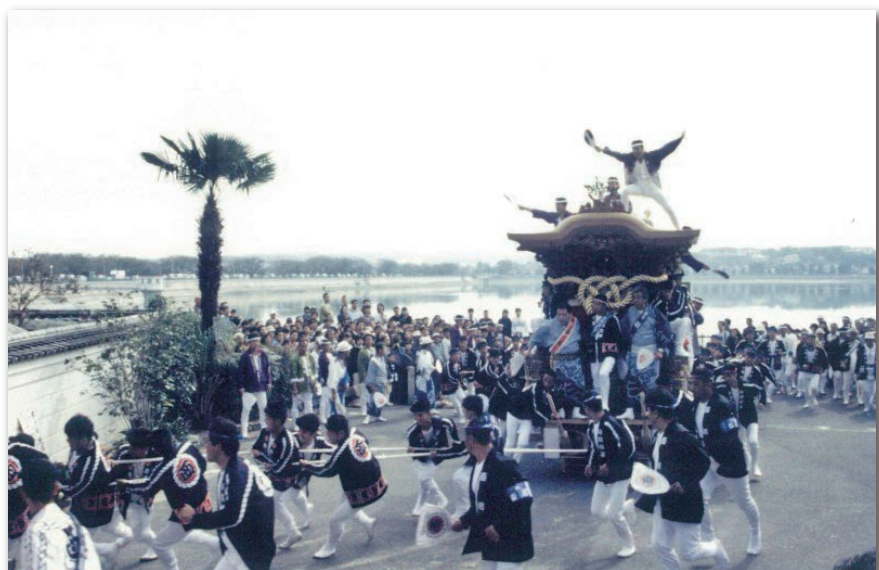
行基参り（10月だんじり祭）