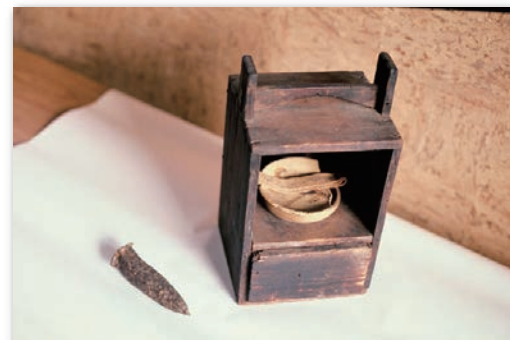
掘削工事に使用した道具 (のみ、灯台)