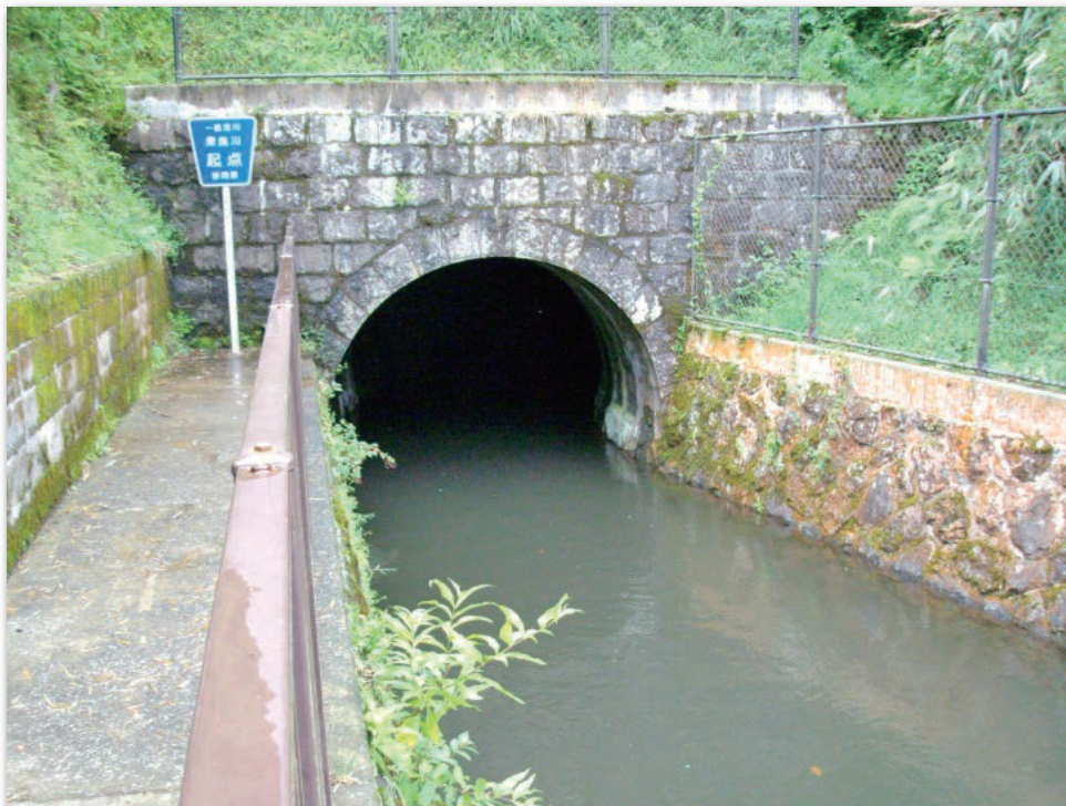
馬蹄形の流れが緩やかな箇所

■極めて精度が高く、掘削合流地点での誤差はわずか1mで、その後の日本の水路トンネル事業の模範。また、利水者は今でも湖を管理する箱根神社に感謝。