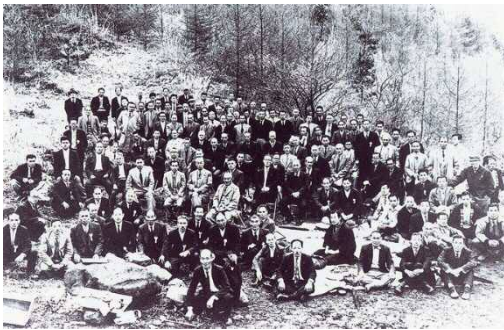
西沢取水口改修記念(昭和32年撮影)