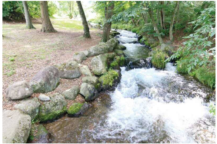
川子分水付近の自然に配慮した水路