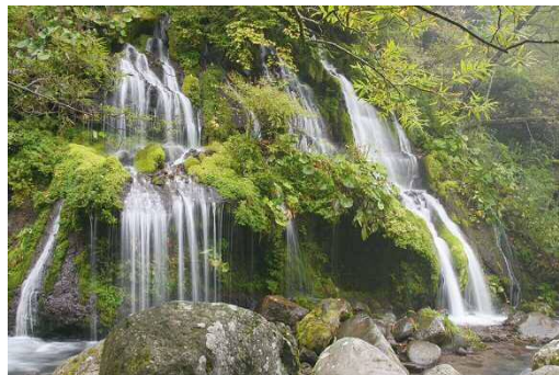
今もなお大地の恵みを育む吐竜の滝(現在)