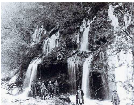
水源となる吐竜の滝(昭和4年撮影)