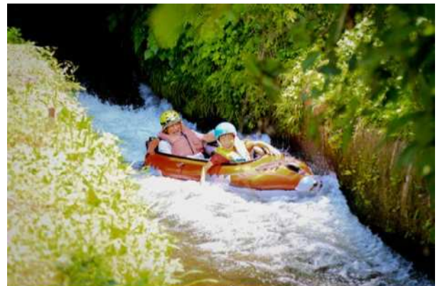
原井手下り「イデベンチャー」