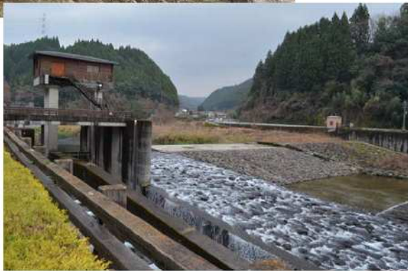
古川兵衛井手 取水部