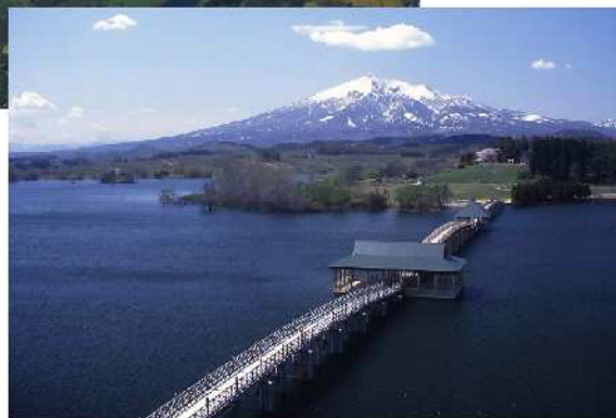
廻堰大溜池と岩木山