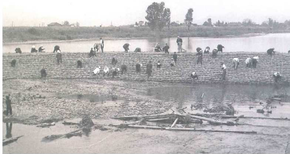
昭和33年以前の土淵堰補修状況（俵積み作業）

■廻堰大溜池は、堤の長さが日本一を誇る約4,100mの大規模ため池であり、岩木山を映す美しい景観が広がる。