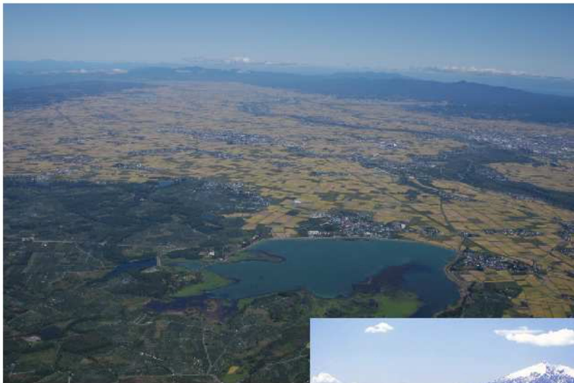
上流からの西津軽地区